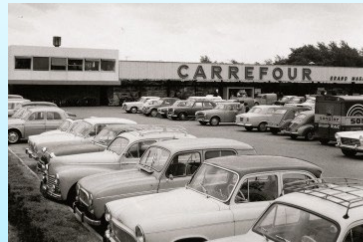
Un supermarché en 1960

★ A la fin des années 70 , l'économie s'essouffle. La hausse des prix du pétrole, énergie essentielle, la baisse de la demande et la robotisation des usines entraînent une forte hausse du chômage. La période des Trente Glorieuses prend fin.