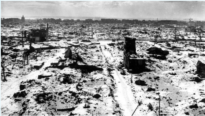
Le Havre 1945.

À la suite de la guerre, des régions entières sont complètement dévastées. De vastes programmes de reconstructions sont lancés et intègrent les dernières avancées en matière d'urbanisme et d'architecture.