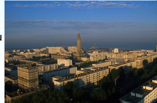
Le Havre aujourd'hui

Les rues sont agrandies et chaque habitation possède l'électricité, l'eau courante et des toilettes reliées aux égouts, ce qui n'était pas forcément le cas avant!