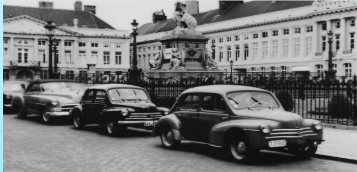
Des Renault 4cv

Les Français achètent de plus en plus et en plus grande quantité , même les produits de base que l'on peut trouver moins cher dans les premiers supermarchés. En même temps, de nombreux Français s'achètent une voiture. On appelle cela la société de consommation.