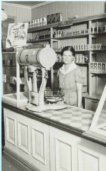
Une épicerie en 1930

Les Français achètent de plus en plus et en plus grande quantité , même les produits de base que l'on peut trouver moins cher dans les premiers supermarchés. En même temps, de nombreux Français s'achètent une voiture. On appelle cela la société de consommation.