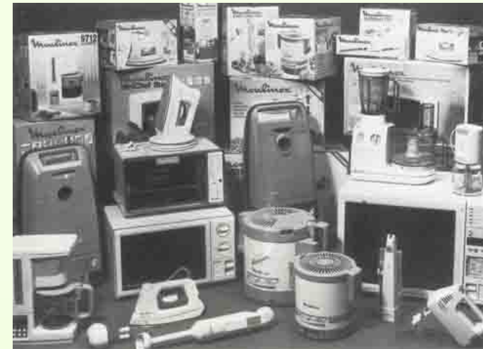
Les nouveaux produits de la gamme Moulinex

On voit aussi apparaître de nouveaux produits comme le réfrigérateur, la machine à laver ou le téléphone qui se répandent de plus en plus rapidement.